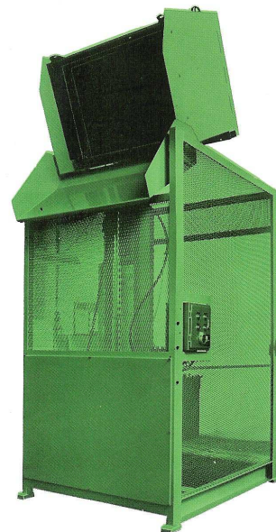
NIVOMAT EHK - elektrohydr.