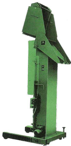
NIVOMAT EMK- elektrohydr.

Hebe- und Kippgeräte von SCHWARZ gibt es für alle denkbaren Einsätze. Die Typenreihe EMK und EHK ist überwiegend für Materialien gedacht, deren Ziel im Überkopfbereich liegt. Beschicken von Zählwagen, Sortiereinrichtungen oder Rüttler sind nur einige Einsatzmöglichkeiten, welche die Bedienperson von umständlichen und kraftraubenden Arbeiten befreien. Auch hier gilt wie für alle Geräte: Arbeitssicherheit und einfache Bedienung gehören zur Selbstverständlichkeit.