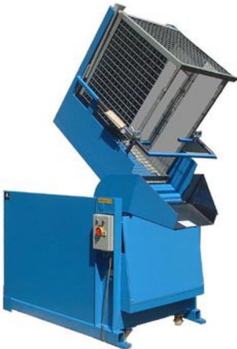
NIVOMAT NH – elektrohydr.

Hebe- und Kippgeräte NIVOMAT rationalisieren den Materialfluss bei manueller Entnahme von Teilen aus Behältern. Ob Beschicken von Maschinen und Fertigungslinien oder Einsatz an Packtischen und Kontrollplätzen – immer wird ein hoher Grad an Zeitersparnis bei müheloser Arbeit erreicht. Die Typenreihe NH hat einen vorgebauten, neigbaren Tisch als Entnahme- und Pufferzone, was Beschickungspausen durch Behälterwechsel verhindert. Auch Umfüllarbeiten von große in kleine Behälter sind problemlos.