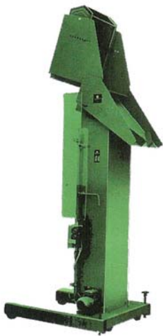
NIVOMAT EMK- elektrohydr.

Hebe- und Kippgeräte von SCHWARZ gibt es für alle denkbaren Einsätze. Die Typenreihe EMK und EHK ist überwiegend für Materialien gedacht, deren Ziel im Überkopfbereich liegt. Beschicken von Zählwagen, Sortiereinrichtungen oder Rüttler sind nur einige Einsatzmöglichkeiten, welche die Bedienperson von umständlichen und kraftraubenden Arbeiten befreien. Auch hier gilt wie für alle Geräte: Arbeitssicherheit und einfache Bedienung gehören zur Selbstverständlichkeit.