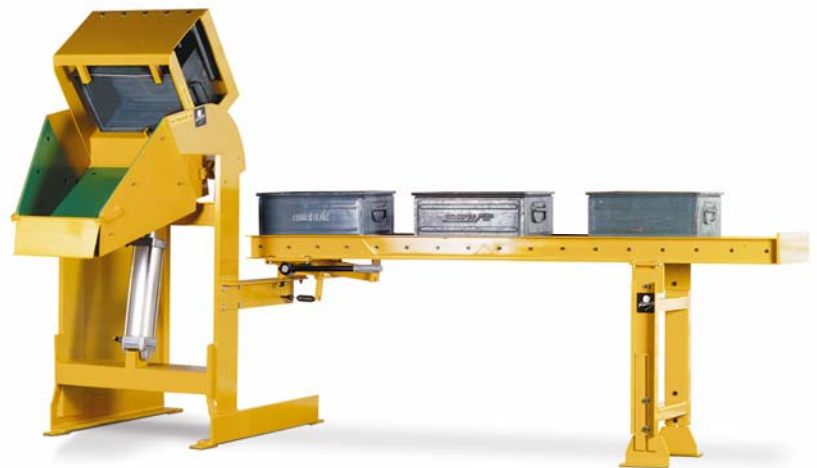
NIVOMAT NH 80 pneum. mit Rollenbahn