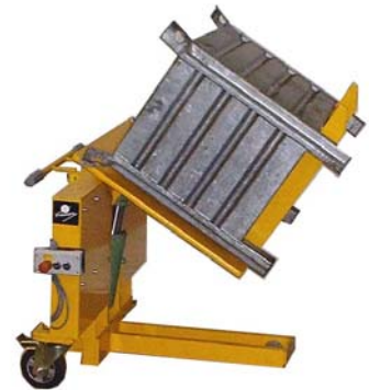
Schwenk- und Neigegerät NIVOMAT TSK – handhydr. NIVOMAT TSKE – elektrohydr.