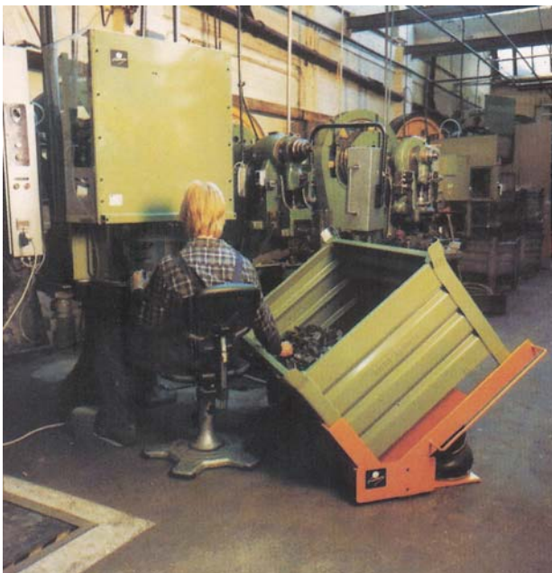
NIVOMAT NP – pneumatisch

Hebe- und Kippgeräte der Typenreihe NP benötigen nur einen Luftanschluss – die baugleichen Geräte der Typenreihe NHH werden handhydraulisch betätigt und haben eine Unterkonstruktion, die ein Beladen mit Stapler erfordern. Diese Unterkonstruktion kann auf Wunsch mit höhenverstellbaren Einsteckfüßen versehen werden (auch für Typ NPU für stehende Tätigkeit). Die Auswahl der Geräte, richtet sich nach Aufgabenstellung und den örtlichen Verhältnissen. Diese Geräte bieten eine besonders preiswerte Möglichkeit für bessere Teile- Handhabung aus Behältern.