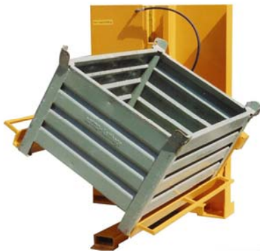
NIVOMAT EHP- elektrohydr. 30°- 45° (rechts und links) schwenkbar