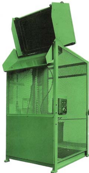
NIVOMAT EHK- elektrohydr.