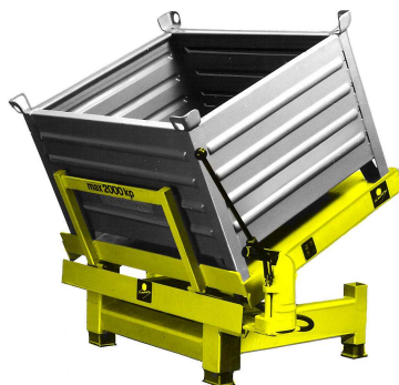
NHH – handhydr. NHE – elektrohydr.