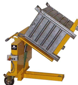
TSK – handhydr. TSKE – elektrohydr