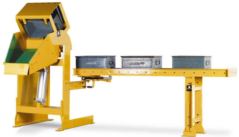
NIVOMAT NH 80 pneum. mit Rollenbahn