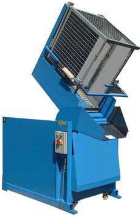
NIVOMAT NH – elektrohydr.